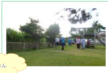
新職員の紹介もあり