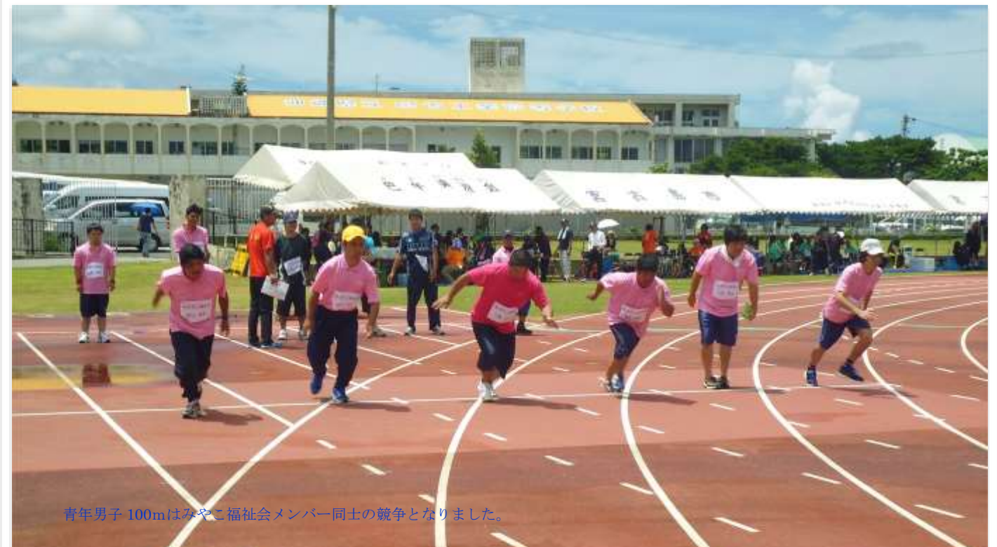
青年男子 100mはみやこ福祉会メンバー同士の競争となりました。

第 10 回宮古地区障がい者スポーツ大会が 6 月 26 日 (日)、宮古島市陸上競技場で開催されました。宮古島全域から 15 団体の選手たちが参加し、トラックとフィールドの部において各競技に各々の力を発揮し競い合いました。同大会は「障害者のスポーツ振興と積極的な参加を促進しスポーツを通じて障がいの克服及び心身の快復と維持増進を図り、明るくたくましく生きる能力を育て自立と社会参加の増進に寄与する」ことを目的に開催されております。開会式を終え競技開始寸前に大雨が降り大会開催が危ぶまれる場面もありました。その後、天気も回復し全ての競技が白熱の内におこなわれました。今大会、みやこ福祉会は総勢約 140 名が参加しました。1 位を取り誇らしげに報告する選手や、入賞を逃し残念がる選手など選手全員が一生懸命、各競技に挑戦しました。最終結果は優勝を逃し 3 位になってしまいましたが、来年こそは優勝を狙いたいです。当日は炎天下の中、けがや熱中症などの事故もなく無事に大会を終えることが出来ました。皆さん大変お疲れ様でした。