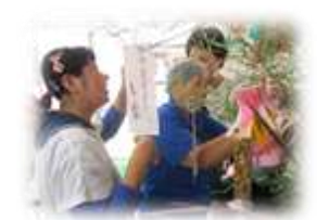
短冊、スイカ、提灯の飾りつけ