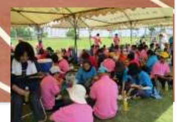
「お楽しみは弁当タイム」