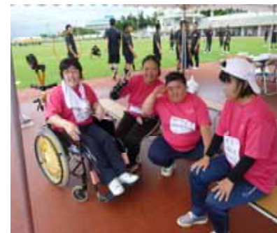
頑張ったよーみんな