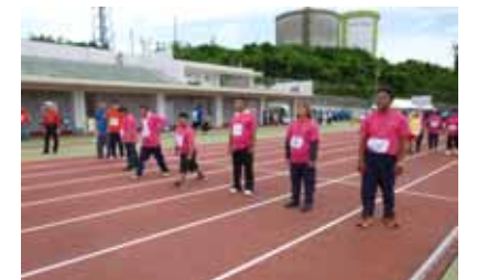
燃やせ！静かな闘志