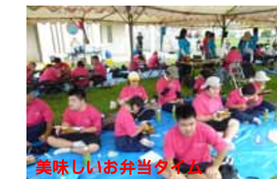
美味しいお弁当タイム