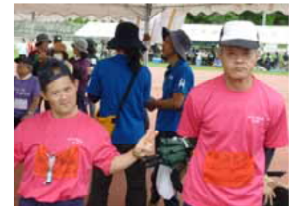
疲れも吹っ飛ばし