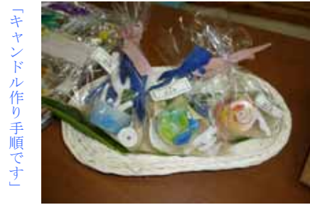
「キャンドル作り手順です」