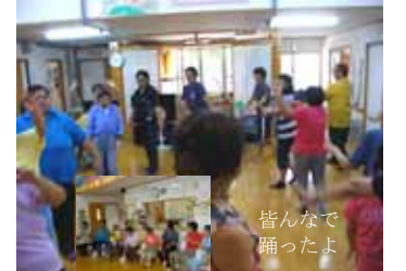
皆さんで踊ったよ

10月18日(土)午後2:00からグループホームみなみの敬老会に招かれ生活介護事業所みやこ他10名の皆さんで参加して来ました。大先輩の方々と一緒に歌や踊りを鑑賞し、私達も「ユイメール」「遊ぶ庭」2曲を踊りました。所狭しで輪になって「ヒヤサッサー」の掛け声が出る程のりのりで会場は笑いと和やかさで大盛り上がり“楽しかったよ〜”と笑顔満開でした。西里