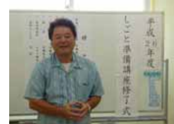
前期「修了式」理事長より祝辞

10月1日(水)より「しごと準備講座」が始まりました。後期講座は、3名の方が受講されることになりました。これから座学(ビジネスマナー、金銭管理、健康管理等)作業実習、企業実習のカリキュラムをこなし、就職できるように取り組んでいきたいと思っておりますので、皆様のご支援ご協力を宜しくお願いたします。