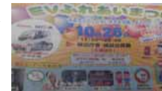
多彩なイベント開催

10月26日(日)の午後から城辺庁舎前にてアダンパン・草花・手工芸・民芸品の販売を行いました。初めての参加で戸惑いも多かったのですが、無事販売を終える事が出来ました。城辺の方で開催されるイベントに参加できたことでみやこ福祉会の商品が宣伝できたことが大変良かったと思います。お買い上げありがとうございました。((=^0^=))