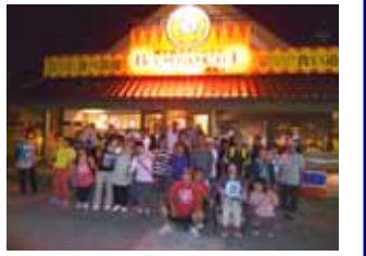
「バンボッシュでスタミナUP」