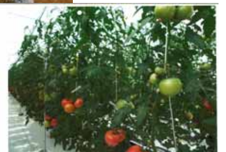
「ポットファーム栽培システムのトマト」