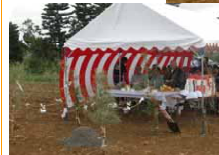
「関係者の皆さんと賑かに地鎮祭」