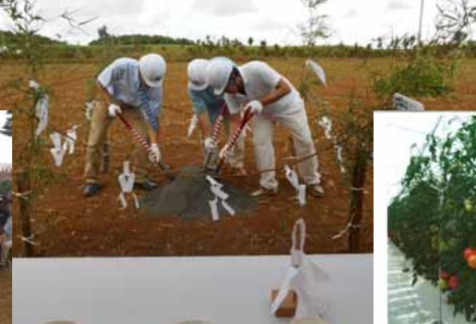
「安全祈願し三者による鍬入れ式」