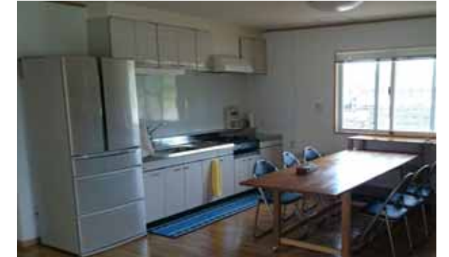
「一同が会する食堂ホール」