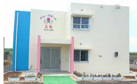
「グループホームとも外観」

みやこ福祉会では日中の活動の場であるみやこ学園やアダナス・野菜ランドみやこ・生活介護などを立ち上げ約100名の障害者の方達が通って仲間達と一緒に楽しく仕事に励んでいます。しかし、親にとっては日中の場の確保は出来ても親亡き後の我が子の生活がどのようになっていくのかが切実な悩みでもあります。そこで、みやこ福祉会は平成21年に最初のグループホームを設立し10名の女性が暮らしています。しかし、まだ多くの方達がグループホームを希望している事もあり、今回第2のグループホームともを立ち上げました。親の不安の解消と障害者自身の自立した生活をエンジョイ出来るよう支援して行きたい。ここを利用する方達や親の皆様がここ宮古島で生まれて良かった、産んで良かったと思える事が出来たら幸いに思います。これも偏に保護者をはじめ関係機関、関わって頂いた多くの皆様方のご協力の賜と心から厚くお礼申し上げます。このグループホームともを利用する方々に対しては、世話人が一人一人の自分らしく当たり前で暮らす事を大切にする場所、一日の流れをそれぞれのペースに合わせて時間にゆとりを持って過ごして頂ける居場所作りに努めて参りたいと考えています。又、心と心のふれあいと家庭的で居心地の良い雰囲気づくりとゆったりと過ごして頂けるようスタッフ一同心がけていく所存です。