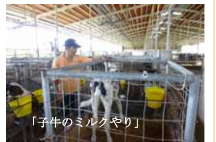
「子牛のミルクやり」