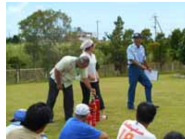
「防火管理者より消火器についての説明」