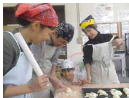
「焼き上がりがたのしみだね」