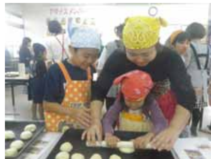
「親子で楽しそうですね。」