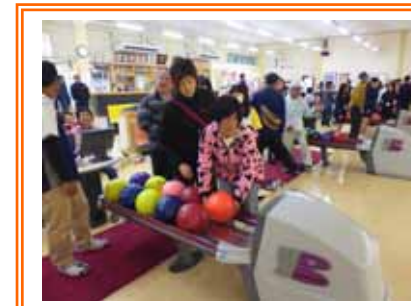
「これが私のボール?」