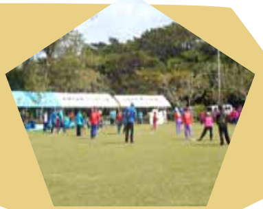
猛春さんピッチャー裕章さんコーチ名コンビ