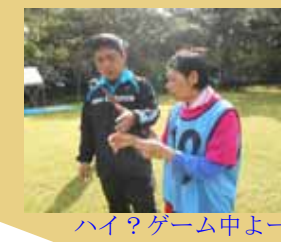
ハイ？ゲーム中よー。