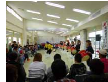
「会場一杯に繰り広げられた演舞」