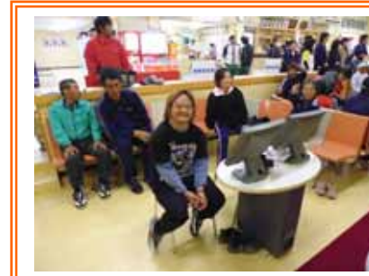
「達士さんスタートまだですか?」