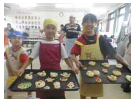
「かわいく出来ましたー」