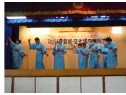
「練習の成果バッチリ！」