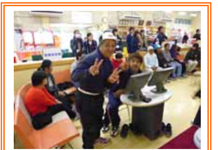
「やったぜ! ストライク」