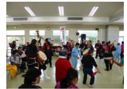
「利用者も加わりミルクムナリ共演」