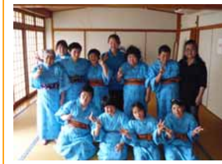
「講師を囲んでありがとう！」