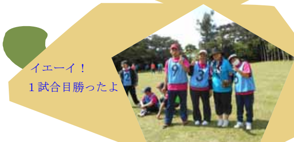
イエーイ！ 1試合目勝ったよ