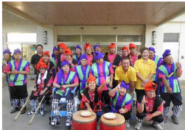
下地ご夫妻を囲んで