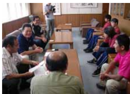
激励の言葉に笑顔も弾ける