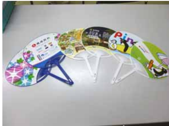
各団体よりうちわの贈呈