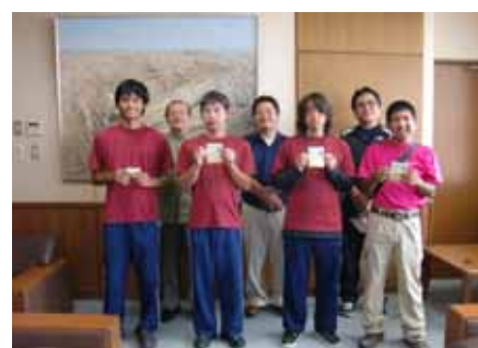
免許証を手一同で！