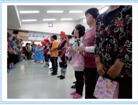
「プレゼント交換も」