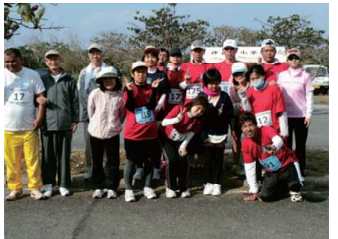
「全員完走し記念撮影」

今年も行ってきました。去った2月24日(日)宮古島市のお隣「伊良部島」で行われたロマン海道マラソンに学園利用者、就労メンバー(走ろう会)家族、職員と総勢22名で参加してきました。毎年恒例の弁当、その他諸々等を準備していざスタート!!メンバーそれぞれのコースで挑戦しました。快晴な陽気に恵まれ心地よい汗を流しながらのゴールでした。昨年より(走ろう会)のメンバーはタイム更新したことがうれしかったようです。週3回の練習の成果のお陰ですね。「継続は力なり」と次への目標に向かい燃えています。マラソンを通して、多くの人々とのふれあいを体感して行きましょう。家族の皆さん、いつもいつも有難うございます。ご協力に感謝で～す。