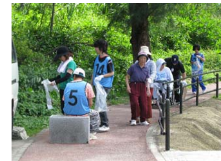
ビーチ歩道で空き缶拾い