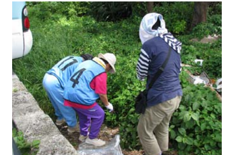
ポイ捨て悪臭ゴミの原因だね