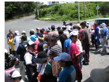
アダナス前で出発式

今回は、各班に別れアダナス周辺からパイナガマビーチまでの一帯を歩きながら落ちていた空き缶やペットボトルなどをみんなで協力しながら拾い集めました。又、ビーチ内に無残に捨てられている山のようなゴミも額に汗しながら黙々分別作業を行っている利用者・職員の姿もありました。何気なく置いてあるゴミですが悪臭の原因や犬猫が食いちぎり放り出された景観なども全員の協力ですっかり綺麗になり「きれいになってよかった～」と満足げにタオルで汗を拭きながら心地よい笑顔を見せていました。短い時間の中、皆さんの頑張りの成果は地域の方々へお礼の気持ちを伝えられた事と思います。小さな奉仕ではありますが、自分たちにできる事を今後も是非続けて行きたいと思っております。皆さんお疲れ様でした。