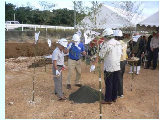
「工事関係者によるくわ入式」