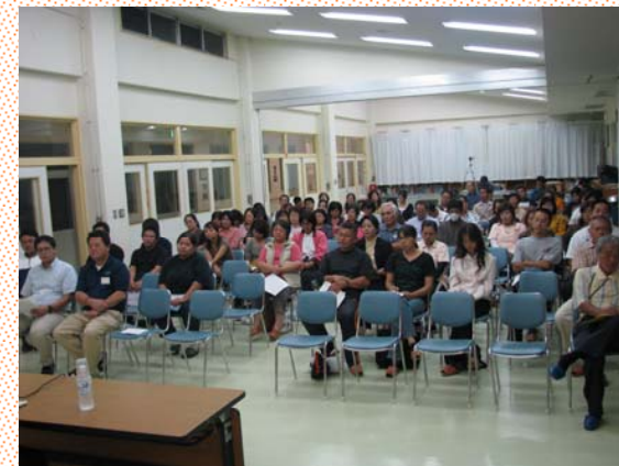
多数の関係者が詰めかけました。