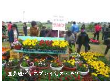
園芸班ディスプレイもステキ?