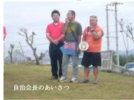
自治会長のあいさつ