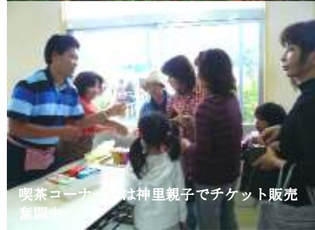
喫茶コーナーでは神里親子でチケット販売 奮闘中