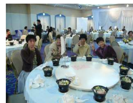
食事がまちどおしー？ そうなアダナスの4人娘たち