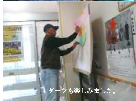
「ダーツ」も楽しみました。