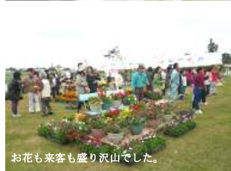
お花も来客も盛り沢山でした。