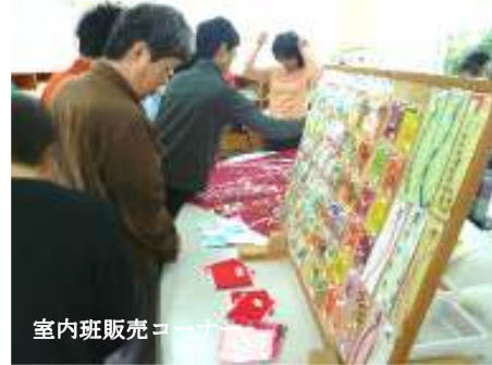
室内班販売コーナー