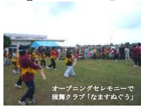
オープニングセレモニーで 琉舞クラブ「なますぬぐう」