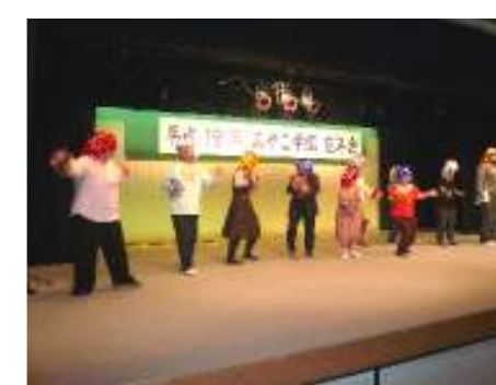
園芸班のフラダンス？ 金髪・赤髪がとっても似合っているよ