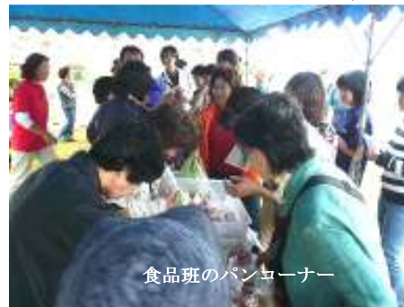
食品班のパンローナー