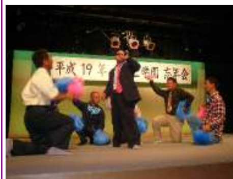
出向班の皆さん チームワークのよさが感じられました。

12月28日(金)にホテルアトールエメラルド宮古島(張水の間)で今年一年の締めくくりとして、盛大に忘年会が行われました。関係各位、保護者、利用者、職員と大勢の皆さんが参加してくださりと盛り上がりました。特に班別の余興は、利用者の紹介や「今年1年このようなことを頑張りました」とか「こんな事を重点に取り組みました」など各班の個性が出てとても楽しかったです。また現在は、一般企業に就職をして頑張っている皆さんも、近況報告等を行った後、余興も披露し、最後は会場全体でクイチャーを踊り忘年会を終えました。参加してくださった皆様方本当に有難うございました。