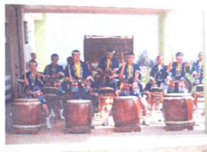
光の村太鼓隊の皆さん