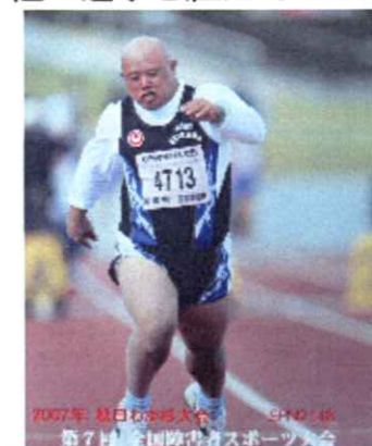
2007年 秋田県障害者スポーツ大会 第7回 全国障害者スポーツ大会

この大会で、たくさんの経験と出会いと感動を貰うことが出来たことに感謝したいと思います。