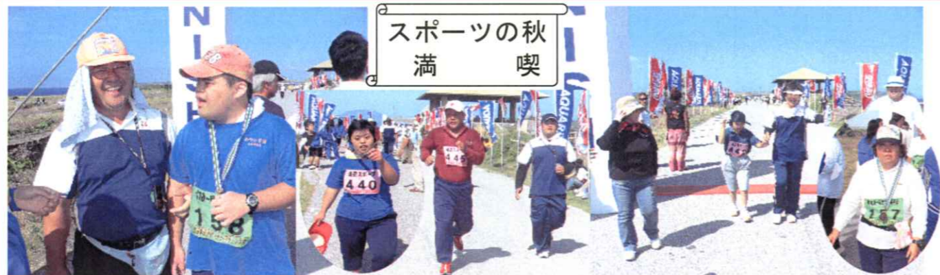
「東平安名崎タートルマラソン大会で運動不足解消?」「遅い貴方が主役です。」

平成19年10月28日(日)東平安名崎タートルマラソンが行われました。天気にも恵まれ、マラソン日よりとなり、コンディションも最高で、今回は、那覇でのゆうあいスポーツ大会と重なり学園は(Aコース1名、Cコース12名、Dコース2名)の少人数の参加でした。各々のペースで走るというよりもウォーキング。おしゃべりしながら景観をながめつつ楽しくマイペースで!日頃の運動不足解消になったかな?という状況でした。途中で体調不良を訴える利用者もいましたが、何とか全員無事にゴールすることができました。