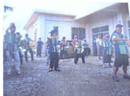
みやこ学園エイサー隊の皆さん